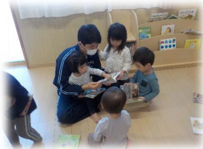
エンジェル kids ひだまり園