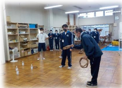
ジョブプレイスのぞみふぁーむ