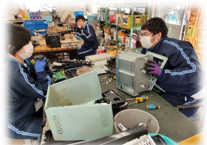
ジョブプレイスすくらむ

準備や練習してきた出し物やクイズ、ゲームなどで楽しく交流をしてきました。1学期から学習してきた「福祉」について、より理解を深め、視野を広げることができました。