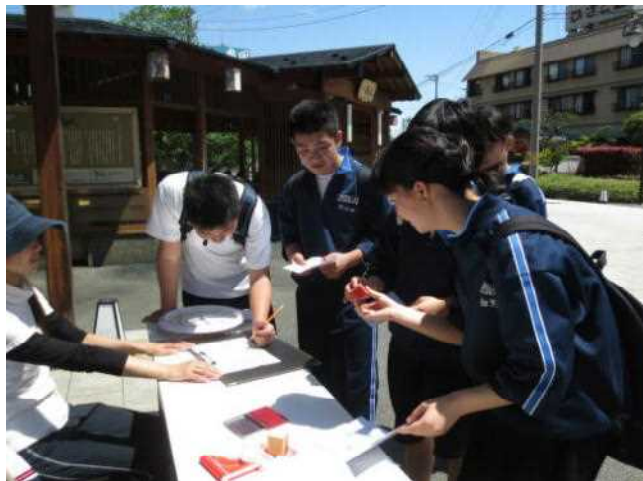
最初のチェックポイント「足湯」。ここまでが長い！

午前中は風も吹き爽やかでしたが、午後からは気温も上がり、日差しも強くなるなど、熱中症が心配される中での実施となりました。