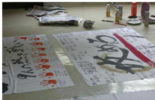
意気込みを書き込んだ旗