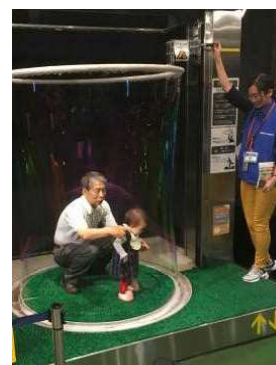
巨大シャボン玉に入る

しかし、私が今回感じたように、実物を見るということは、全く別物です。画面の中で見る体験だけでなく、実際に実物を見る体験はやはり大切なんだと改めて実感した二日間でした。そして、このことから、5月1日（月）の全校朝会の話の内容を、「実際に体験することの大切さの話」に急きょ変えました。