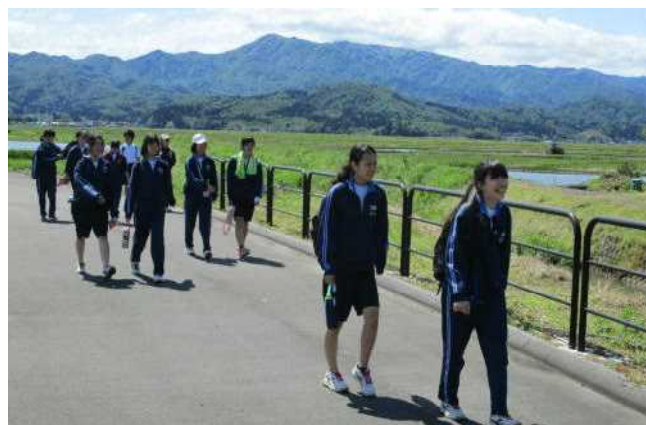
新緑の中を歩く。景色を見る余裕はあったかな？