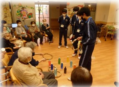
愛宕の園サービス